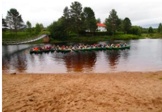
20 kanoer på elva